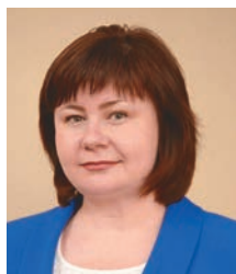
Виктория Торукало, первый заместитель министра социального развития Оренбургской области:

— В честь векового юбилея службы награды получили более 300 сотрудников системы социальной защиты населения Оренбургской области.