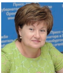
Татьяна Самохина, министр социального развития Оренбургской области:

– Сегодня для эффективной деятельности системы социальной защиты населения требуются ответственные и инициативные работники, высокоорганизованные и стремящиеся к трудовой самореализации личности. Только те люди, которые осознают смысл своей деятельности и стремятся к достижению целей организации, могут рассчитывать на получение высоких результатов.