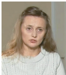
Светлана Петрова, директор департамента демографической политики и социальной защиты населения Министерства труда и социальной защиты РФ:

— Уважаемые сотрудники и ветераны системы социальной защиты Оренбургской области!