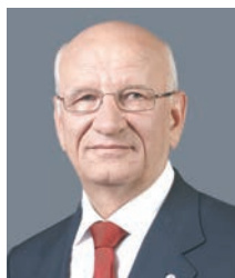
Юрий Берг, губернатор Оренбургской области:

— Сегодня Правительство области работает над актуализацией Стратегии до 2030 года. К концу следующего десятилетия продолжительность жизни должна составлять более 80 лет. При этом люди должны жить полноценной, здоровой жизнью как минимум до 67 лет, увеличивая этот порог год от года.