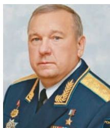
Владимир Шаманов, депутат Государственной думы, председатель комитета по обороне, Герой РФ, генерал-полковник:

«Твори добро на всей земле, Твори добро другим во благо Не за красивое спасибо Услышавшего тебя рядом...» ■