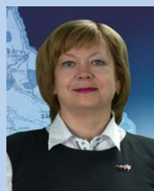
ТАТЬЯНА МОШКОВА, министр финансов Оренбургской области:

– Каждый участник внес в нашу общую копилку по монеточке, а в сумме мы оказались первыми. Министерство финансов – это настоящая команда. На спартакиаде мы еще раз в этом убедились. Поздравляю.