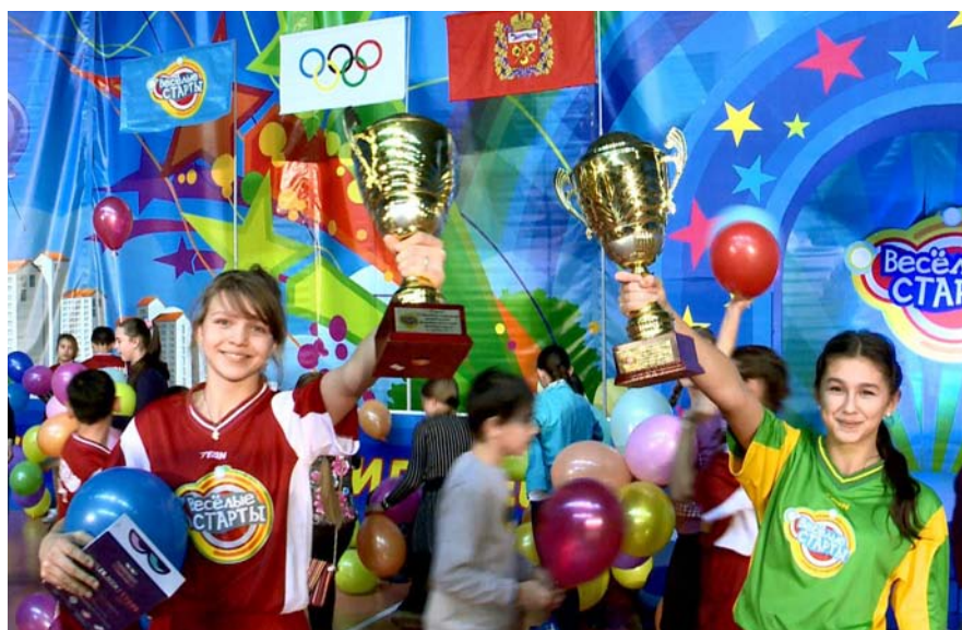
КОГДА ПОБЕДА В РУКАХ: УЧАСТНИЦЫ КОМАНД «УЛЕТ» И «АВРОРА»

P.S. Писать о «Веселых стартах» – все равно, что вести кулинарное шоу на радио: передать запах блюд, а в нашем случае атмосферу увлекательных соревнований – практически невозможно: нужно окунуться в нее и все увидеть своими глазами, если не в реальности, то хотя бы по телевизору. Суперфинальная серия 9-го сезона «Веселых стартов» в эфире «ОРТ-Планета» 26 и 27 декабря, не пропустите!